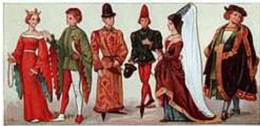
DRESS OF ANCIENT PERIOD (SEE DESCRIPTION FOLLOWING)